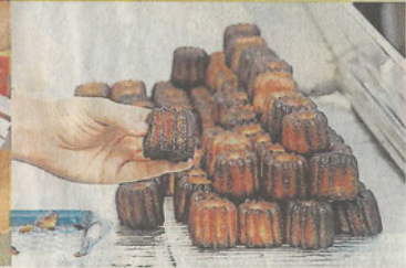
Cannelé breton, kilt Brittany Scot, cornemuse électronique et livre d'art sur l'Irlande et l'Islande, la rédaction a sélectionné quatre produits celtes, traditionnels ou révisités.