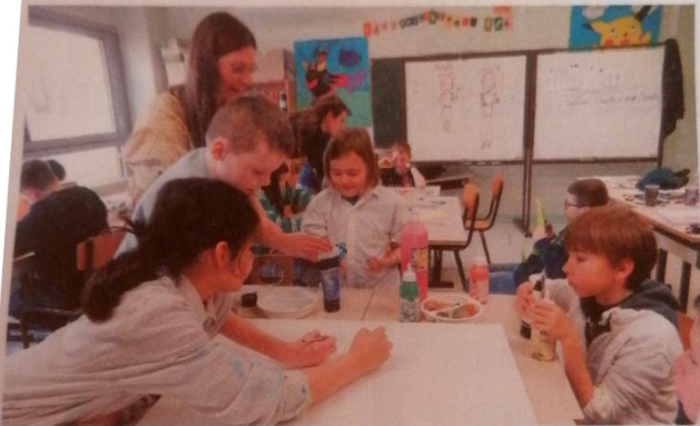
Les œuvres réalisées par les enfants seront exposées au retour des vacances scolaires.