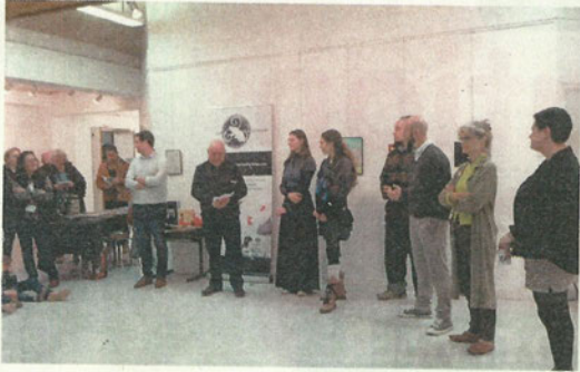
Lors du vernissage..

Fidèle à sa tradition d'ouverture à l'art contemporain sous toutes ses facettes, l'amicale laïque expo a invité trois illustrateurs aux talents divers dans le cadre du mois du livre en Bretagne, manifestation d'envergure régionale, en partenariat étroit avec la maison d'édition «Les Tardigrades».