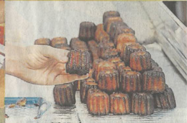
Cannelé breton, kilt Brittany Scot, cornemuse électronique et livre d'art sur l'Irlande et l'Islande, la rédaction a sélectionné quatre produits celtes, traditionnels ou revisités.